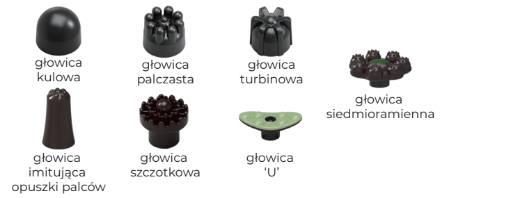
głowica kulowa głowica palczasta głowica turbinowa głowica siedmioramienna głowica imitująca opuszki palców głowica szczotkowa głowica 'U'